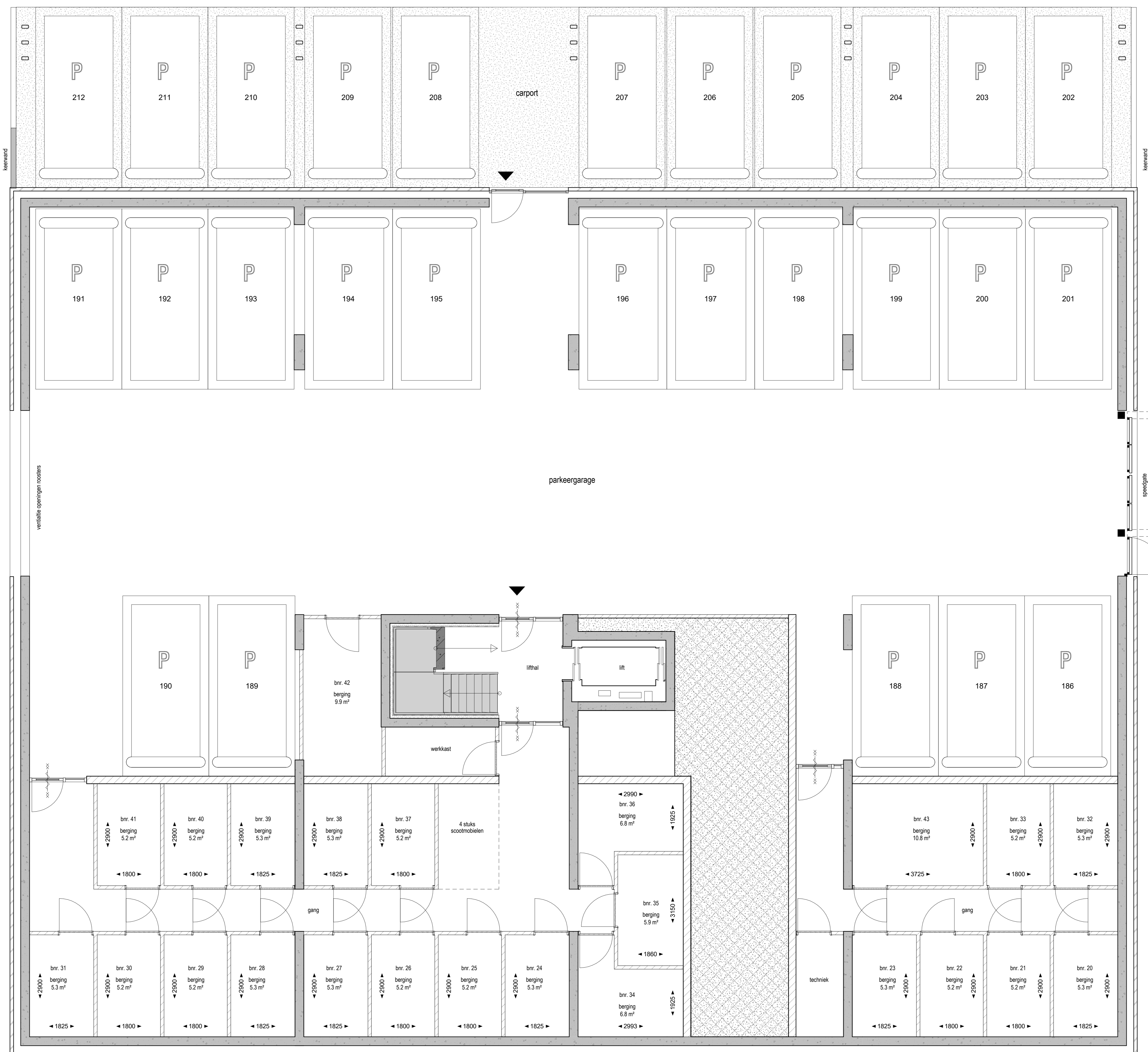
Kelder gebouw B 1:50