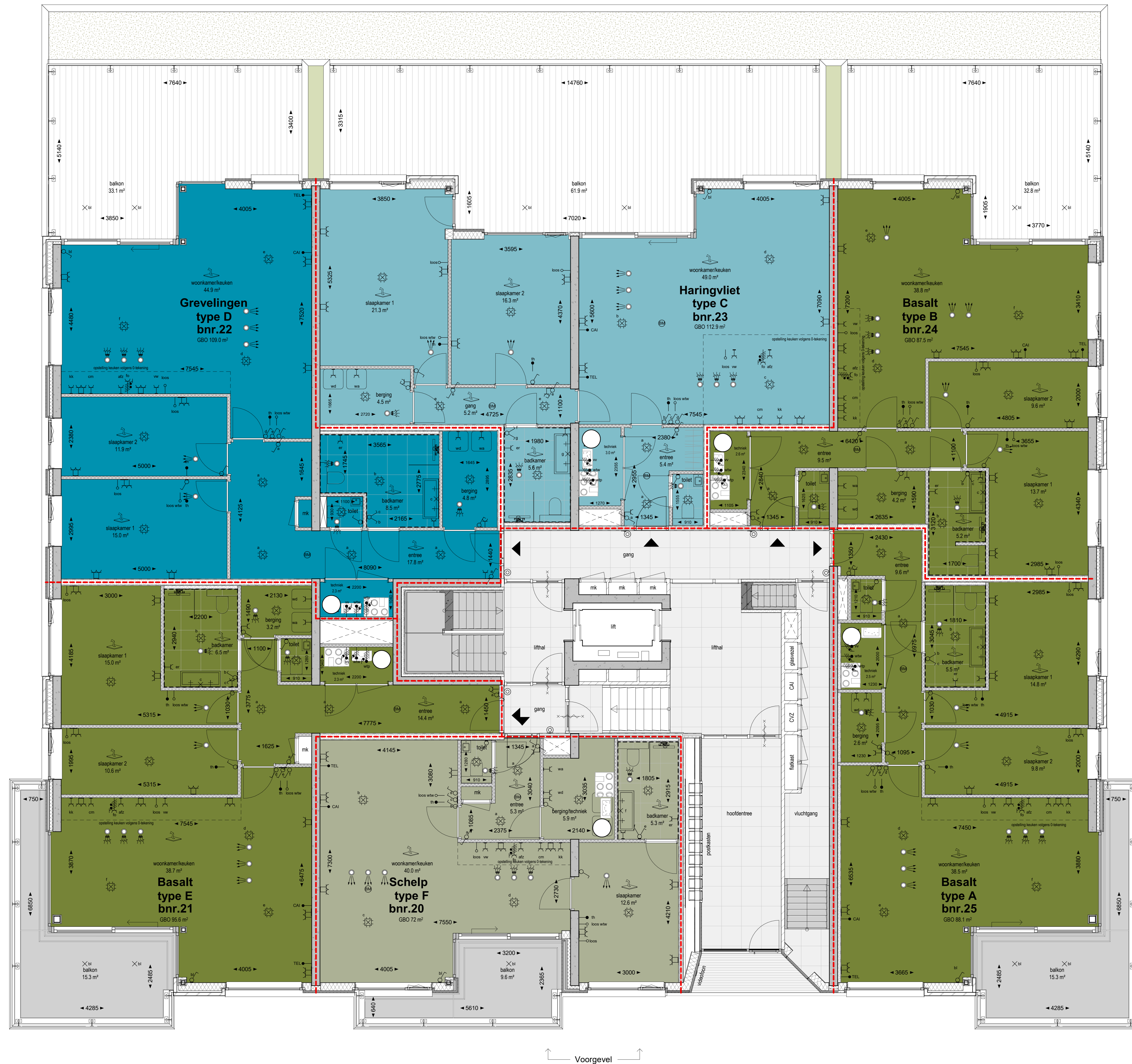
Begane grond gebouw B 1:50